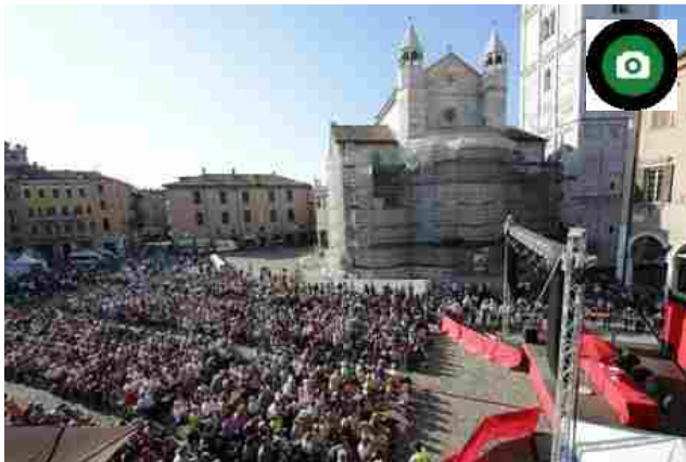
FESTIVAL DELLA FILOSOFIA 2014