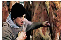
I 70 anni di Sylvester Stallone, 40 anni fa il primo Rocky - Cultura & Spettacoli