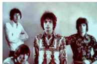
Syd Barrett, 10 anni fa moriva fondatore dei Pink Floyd - Cultura & Spettacoli