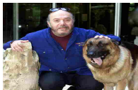
Lino Banfi e i suoi primi 80 anni - Cultura & Spettacoli