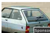
Le 10 macchine che hanno fatto la storia... in negativo!