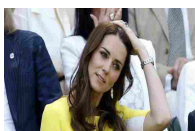
Kate a Wimbledon in giallo canarino - Cultura & Spettacoli